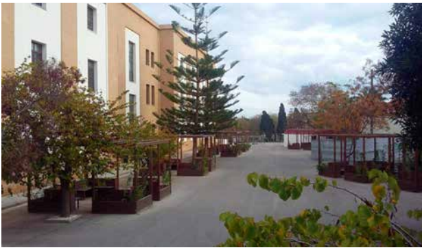
Εικόνα 2: Προαύλιος χώρος του ΤΜΣ

Αποτελεί τμήμα της Σχολής Ανθρωπιστικών Επιστημών 2 και αποστολή του είναι «η καλλιέργεια και προαγωγή της γνώσης για τη γλώσσα, την αρχαία και νεότερη ιστορία, τον αρχαίο πολιτισμό, τις οικονομικές και πολιτικές δομές των χωρών της Μεσογείου, με έμφαση στη νότια και νοτιοανατολική Μεσόγειο».