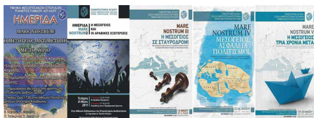
Εικόνα 6: Ημερίδες και συνέδρια του ΤΜΣ

Ολοκληρώνοντας την παρουσίαση του ΤΜΣ, πρέπει να τονιστεί ότι το Πανεπιστήμιο Αιγαίου - στο πλαίσιο διασφάλισης ποιότητας - συμμετέχει στο σύστημα διεθνούς αξιολόγησης ακαδημαϊκής κατάταξης «Times Higher Education Young University Rankings» καταλαμβάνοντας μάλιστα την 3 η θέση ανάμεσα σε 7 ελληνικά Πανεπιστήμια και θέση 201-250 ανάμεσα σε 539 Πανεπιστήμια παγκοσμίως για το 2022 και την 4 η θέση ανάμεσα σε 18 ελληνικά Πανεπιστήμια και θέση 801-1000 ανάμεσα σε 2.325 Πανεπιστήμια παγκοσμίως για το 2023.