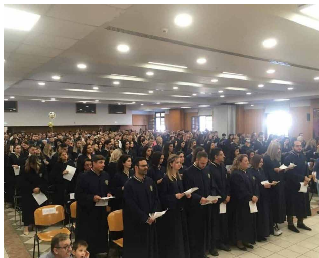
Εικόνα 5: Τελετή αποφοίτησης-καθομολόγησης του ΤΜΣ

Όσον αφορά τη φοιτητική μέριμνα, το ΤΜΣ παρέχει αρκετές διευκολύνσεις στους φοιτητές-φοιτητρίες του, σχετικά με τη διατροφή, τη στέγαση και την περίθαλψη. Επίσης παρέχεται η δυνατότητα προβολής του ερευνητικού έργου των φοιτητών-διδασκόντων μέσω διάφορων περιοδικών εκδόσεων, όπως η εξαμηνιαία επιθεώρηση «Η Ελλάδα, η Ευρώπη και ο Κόσμος» της Μονάδας Έρευνας για την Ευρωπαϊκή και Διεθνή Πολιτική και η «Επετηρίδα Μεσογειακών Σπουδών».