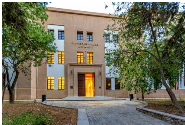
Εικόνα 1: Η είσοδος του ΤΜΣ

Το Τμήμα Μεσογειακών Σπουδών (ΤΜΣ) του Πανεπιστημίου Αιγαίου αποτελεί μία από τις πιο πρόσφατες δομές παροχής ανώτατης εκπαίδευσης της χώρας μας και η μοναδική στην Ελλάδα με εξειδίκευση τις Μεσογειακές Σπουδές. Ιδρύθηκε το 1997 με έδρα την όμορφη πόλη της Ρόδου και η λειτουργία του ξεκίνησε το ακαδημαϊκό έτος 1999-2000. 1