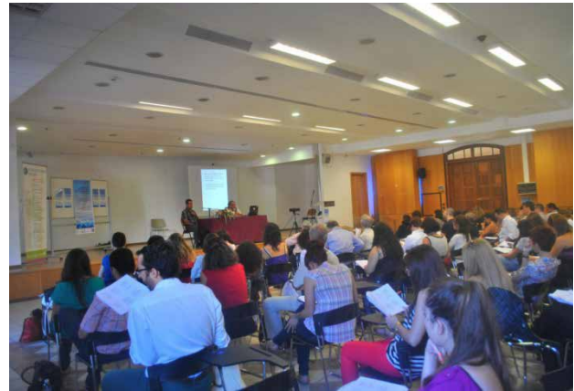
Εικόνα 3: Αίθουσα διδασκαλίας ΤΜΣ Πηγή: Τμήμα Μεσογειακών Σπουδών

Στο πλαίσιο επίσης της λειτουργίας του ΤΜΣ λειτουργεί Εργαστήριο Αρχαιομετρίας, Εργαστήριο Μεσογειακής Πολιτικής, Εργαστήριο Πληροφορικής, Εργαστήριο Γλωσσολογίας, Εργαστήριο Περιβαλλοντικής Αρχαιολογίας και Προληπτικής Συντήρησης, καθώς και Εργαστήριο για τον Αρχαίο Κόσμο της Ανατολικής Μεσογείου.